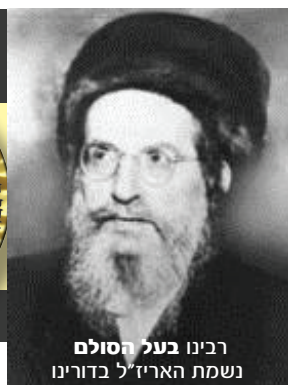
רבינו בעל הסולם נשמת האריז"ל בדורינו